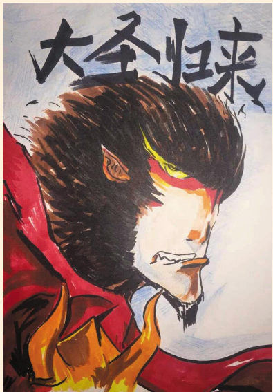
漫画 物资分公司 余方蔚

市政建设(集团)有限公司第一届“市政集团杯”足球赛,终于在每一位参与者的热情和付出中圆满结束。每一场比赛中都每一位球员都为自己公司为自己全力拼搏,球场上球员的每一滴汗水都包含着场外摇旗呐喊同事们的鼓励和支持在热辣辣的阳光下放肆的闪亮,在三强花落各家之后,激动和热情慢慢的平淡了下来,在很多人眼里这一切拉下了帷幕,而在我的心中这一切不是结束才是开始。