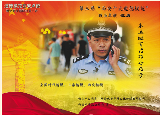
西安道德模范公益广告宣传

8 月 6 日-7 日,集团公司团委组织团员青年参加了为期两天的野外拓展训练,短短的两天拓展训练时间,大家在一起不时有让人深受感动的事情发生,让我印象最深刻最大总结的有三个方面: